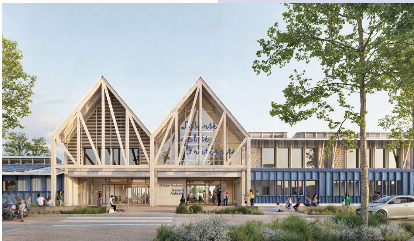
Un visuel de la future école de Ouistreham

Malgré la baisse des effectifs, la ville doit permettre à chaque enfant ouistrehamais de s'épanouir tout au long de son parcours éducatif : en dialoguant avec la communauté éducative et les parents d'élèves, en permettant d'accéder aux meilleurs équipements, en apportant l'accompagnement indispensable à l'éveil et à la sécurité de nos jeunes.