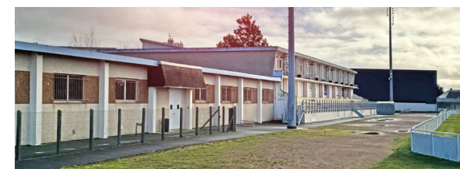
Les salles Cavalier et Kieffer qu'il faut rénover.

Développer et promouvoir tous les sports en lien avec le littoral (plage, mer et vent) en s'appuyant sur les équipements et les associations existantes (CANO, SRCO, OCEAN...) et structurer les activités de l'espace de plein air entre la piscine et le skate park.